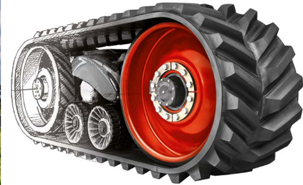
TERRA TRAC mit patentierter Kinematik und zuverlässigen, langlebigen Komponenten

Für den JAGUAR haben wir das TERRA TRAC Konzept konsequent weiter gedacht. Der JAGUAR TERRA TRAC ist der erste Feldhäcksler mit einer serienmäßigen Lösung für die boden- und grünlandnarbenschonende Befahrung. Die Vorgewendeschonung verringert die Aufstandsfläche bei Kurvenfahrten um ein Drittel und schont die Grasnarbe. Damit ist es erstmals möglich, die Vorteile des Raupenlaufwerks das ganze Jahr über auf allen Flächen zu nutzen.