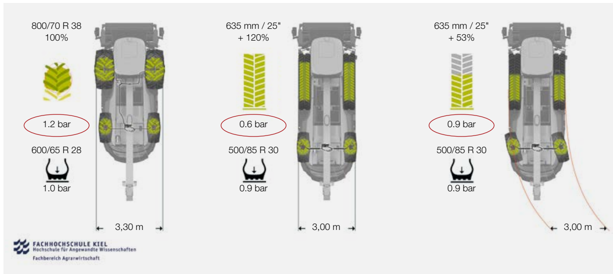
Messergebnisse des Bodendrucks: Radmaschine im Vergleich zu TERRA TRAC

Untersuchungen der Fachhochschule Kiel belegen die positiven Effekte der Bodenschonung. Ein mit dem TERRA TRAC Raupenlaufwerk ausgerüsteter JAGUAR verursacht bei Geradeausfahrten einen deutlich geringeren Bodendruck als die Radmaschine mit den Bereifungen 800/70 R 38 vorn bzw. 620/70 R 30 hinten.