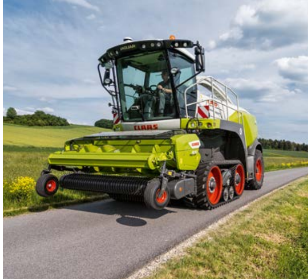
Hoher Fahrkomfort durch hydropneumatische Federung

Mit TERRA TRAC gestalten Sie die Umsetzzeiten kurz, bequem und effizient. Sie fahren auf der Straße bis zu 40 km/h schnell und sparen mit reduzierter Motordrehzahl Kraftstoff. Dank der Zulassung als Gleiskettenfahrzeug steht dem gesetzeskonformen Fahren mit schweren Vorsatzgeräten nichts im Weg.