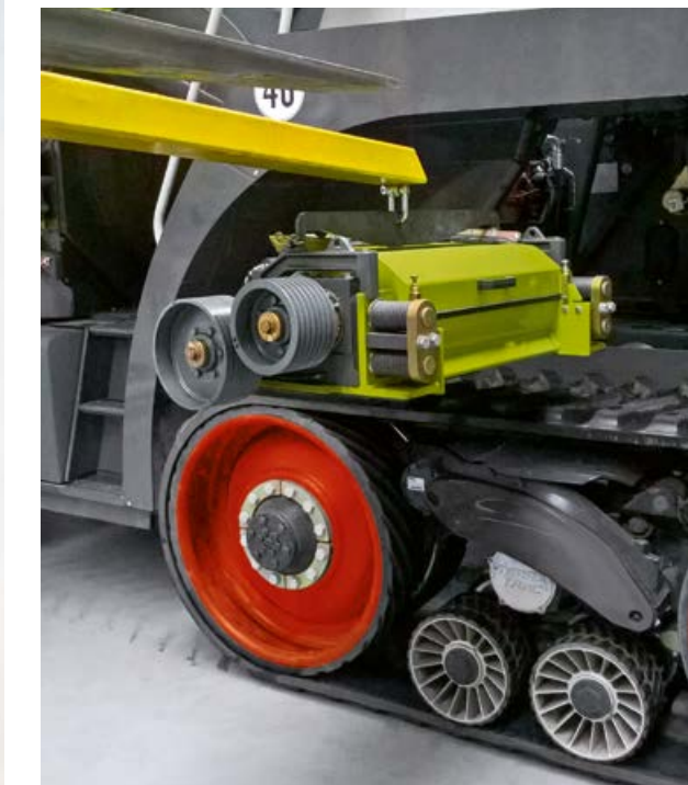
Einfacher Corncrackerausbau über dem Laufwerk