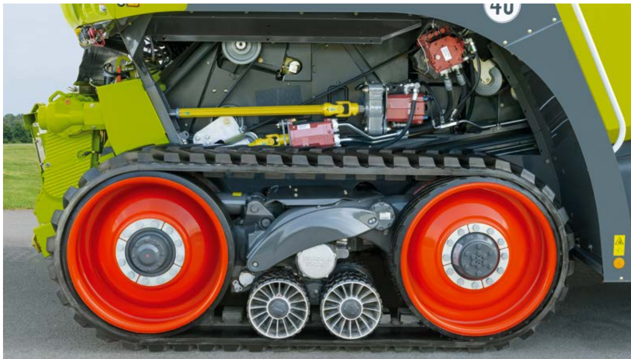
Gut erreichbare Wartungspunkte

Um eine optimale Ballastierung zu ermöglichen und die Raupenlaufwerke räumlich perfekt unterzubringen, wurde das Chassis des JAGUAR TERRA TRAC um 1,01 m verlängert. Das bringt – zusammen mit der geringen Bauhöhe der Raupenlaufwerke – entscheidende Vorteile im Hinblick auf Service, Wartung und Minimierung der Rüstzeiten.