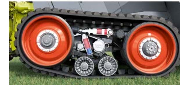
Reduzierte Aufstandsfläche 66%

In Abhängigkeit vom Lenkeinschlag werden die Stützrollen des Raupenlaufwerks automatisch hydraulisch nach unten gedrückt. Nur noch das Triebrad und die Stützrollen halten Kontakt zum Boden. Das reduziert die Aufstandsfläche signifikant.