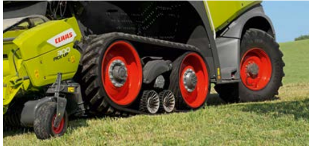
Ausgehobenes Raupenlaufwerk am Vorgewende

Beim Wenden am Feldende oder in engen Kurvenfahrten auf Grünland reduziert der JAGUAR TERRA TRAC die Aufstandsfläche des Raupenlaufwerks automatisch um ein Drittel. Das vermindert nachweislich das Abscheren der Grasnarbe. Selbst beim schmalsten Raupenlaufwerk (635 mm) liegt der Kontaktflächendruck auf Acker oder Wiese immer unter 1,0 bar.