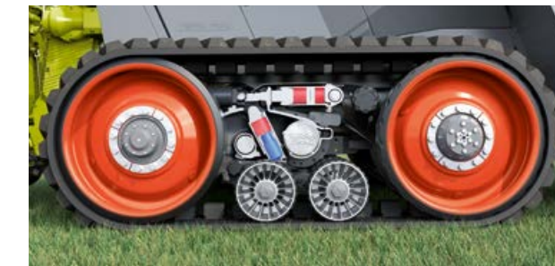
Volle Aufstandsfläche 100%